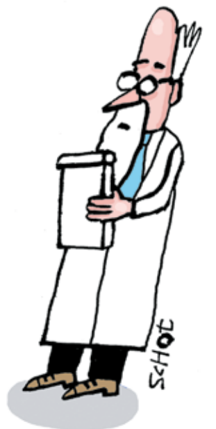
Illustratie: Bas van der Schot

"EEN CIJFER VOOR DE WERK-PRIVÉ BALANS? HOOGUIT EEN ZESJE"